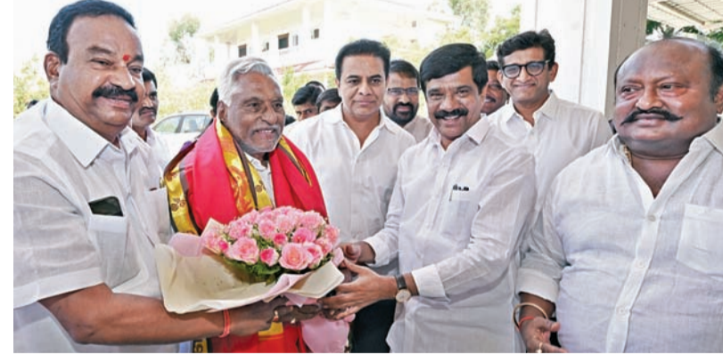
శుక్రవారం ఎర్రపల్లి ఫామ్ హౌస్ కు వచ్చిన జీవన్ రెడ్డికి పుష్పగుచ్ఛాలు అందజేస్తున్న కేసీఆర్ తదితరులు

జీవన్ రెడ్డి కామెంట్స్పై సీఎం రేవంత్ రెడ్డి రియాక్షన్ ప్రభావతార ప్రధాన ప్రతినిధి హైదరాబాద్, ఏప్రిల్ 10: మాజీ మంత్రి జీవన్ రెడ్డి చేసిన వ్యాఖ్యలపై ముఖ్యమంత్రి ఎ.రేవంత్ రెడ్డి తనదైన శైలిలో స్పందించారు. కాంగ్రెస్లో సీనియర్లకు అన్యాయం జరుగుతోందన్న విమర్శలను కొట్టిపారేస్తూనే గత బిఆర్ఎస్ ప్రభుత్వంలో సీనియర్ నేతలకు ఎదురైన పరిస్థితులను ఆయన గుర్తు చేశారు. శుక్రవారం ఢిల్లీలో మీడియా ప్రతినిధులతో జరిగిన బిట్చాట్లో సీఎం ఈ అంశంపై ఆసక్తికర వ్యాఖ్యలు చేశారు. జీవన్ రెడ్డి తనపై చేసిన వ్యక్తిగత విమర్శలకు పెద్దగా ప్రాధాన్యత ఇవ్వాలని ఆయన రేవంత్ రెడ్డి పేర్కొన్నారు. జీవన్ రెడ్డి వ్యాఖ్యలపై నేను ప్రత్యేకంగా స్పందించను అని పేర్కొన్నారు. కాంగ్రెస్లో సీనియర్లకు అవమానం జరుగుతోందని అంటున్న వారు, బిఆర్ఎస్లో నుంచి సీనియర్ నేతలు ఎందుకు బయటకు వచ్చారో చెప్పాలని డిమాండ్ చేశారు. ఒకప్పుడు పార్టీ కోసం పనిచేసిన ఆళ్ల నరేంద్ర, విజయకాంతి, ఈటల రాజేందర్ వంటి నేతలు బిఆర్ఎస్ నుంచి ఎందుకు మీదొచ్చి వచ్చింది? అక్కడ వారికి జరిగిన అవమానం ఎంతో అందరికీ తెలుసు? అని సీఎం అన్నారు. మాజీ పీసీసీ అధ్యక్షుడు పొన్నాల లక్ష్మయ్య ఇప్పుడు ఎక్కడున్నారో, ఆయనకు బిఆర్ఎస్లో దక్కిన గౌరవం ఎంతో కనిపిస్తున్నా ఉందని ఎద్దేవా చేశారు. బిఆర్ఎస్ హయాంలో సీనియర్లకు జరిగిన అవమానాలు గుర్తు లేదా? అని రేవంత్ రెడ్డి ప్రశ్నించారు. కాంగ్రెస్ ఎప్పుడూ తన నేతలను గౌరవిస్తుందని, కానీ కొందరు కావాలని చేస్తున్న విమర్శలకు కాలమే సమాధానం చెబుతందని పేర్కొన్నారు.