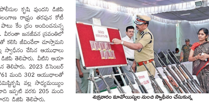
శుక్రవారం మావోయిస్టుల నుంచి స్వాధీనం చేసుకున్న

>>> అయితే, ఆ సమయంలో అతనితో పాటు ఉన్న మద్యం తాగిన స్పైమాతులకు లేదా బంధువులకు వాహనాన్ని అప్పగించాలని కోర్టు స్పష్టం చేసింది. ఒకవేళ అదేమీ ఎవరూ లేని వక్రంలో సదరు వ్యక్తికి సంబంధించిన బంధువులు లేదా స్పైమాతులకు ఫోన్ చేసి అక్కడికి పిలిపించి వాహనాన్ని వారికి అప్పగించేలా చర్యలు తీసుకోవాలని తెలిపింది.