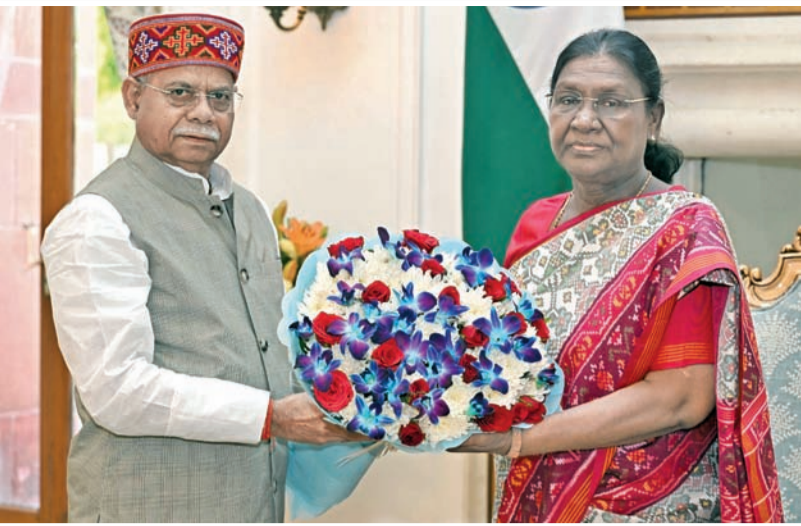
శుక్రవారం న్యూఢిల్లీలో రాష్ట్రపతి ద్రౌపది ముర్మును కలిసిన తెలంగాణ గవర్నర్ శివప్రతాప్ శుక్లా